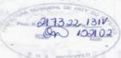
Figura 3 de 14