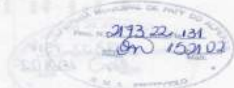
Figura 1 de 14

2.5. A EMPRESA EXECUTORA não poderá subcontratar as obras e serviços no seu todo, profundo, contudo, faz-lo parcialmente em alguns serviços especializados, mediante, porém, a sua responsabilidade direta perante a CONTRATANTE.